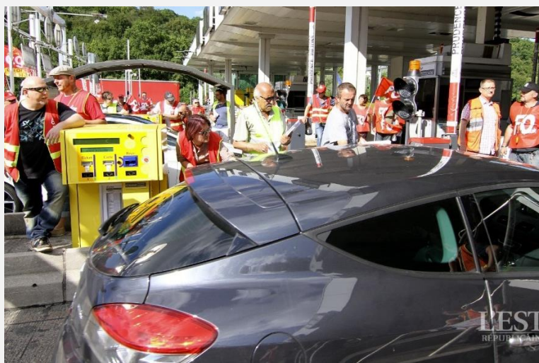
■ Moment de stupéfaction au début du mouvement lorsque les usagers découvrent que le passage est libre et gratuit.