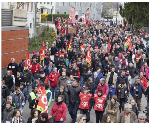
9 avril : C'est samedi mais on ne lâche rien !