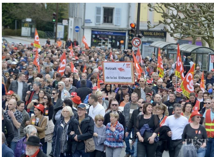
31 mars : 2300 manifestants à Montbéliard