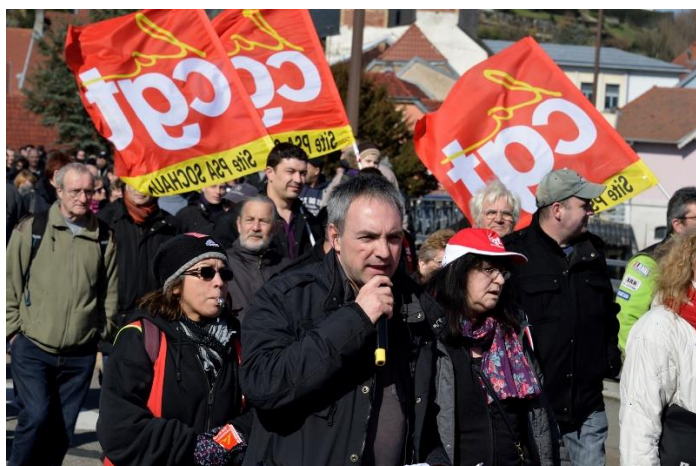
9 mars : 1800 manifestants dans les rues de Montbéliard